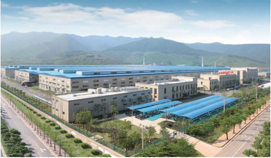
集團循環經濟產業園－浙江基地