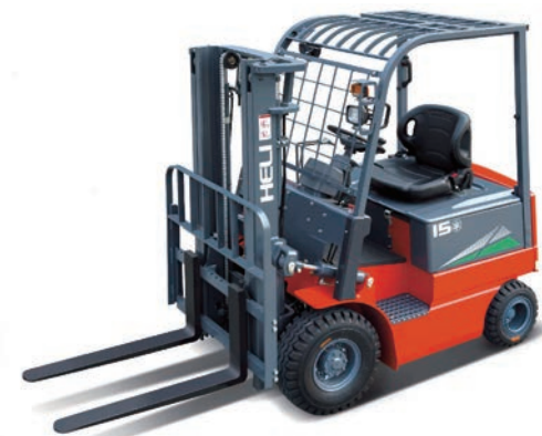
配套天能電池的電動叉車

隨著互聯網經濟與物流產業的發展，電動叉車市場增長迅猛。根據中國產業信息網統計，2017年全國叉車銷量超過37萬輛，其中電動叉車佔比由2011年的11%快速提升至2017年的40%，全國共有20億元電池需求。目前，天能叉車電池與安徽合力、杭叉集團、林德叉車、諾力叉車結成戰略合作夥伴關係，已成為全國國產第二大品牌。