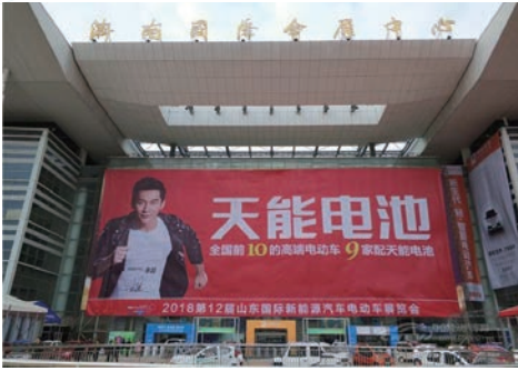
山東「第十二屆國際新能源汽車電動車展覽會」現場、天津「第十八屆中國北方國際自行車電動車展覽會」現場