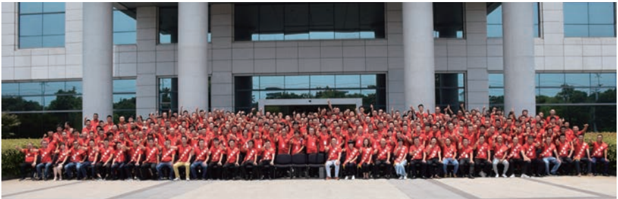
「榜樣的力量 — 全國優秀共贏商大會」在天能集團順利舉辦

專用車電池主要用於場地車、清潔車、警用車等特定車型。根據中國產業信息網數據，2017年專用車市場銷量為30萬輛，年複合增長率為20%，增長前景廣闊。報告期內，本集團助力2018俄羅斯世界盃，其場地車100%配套天能電池。