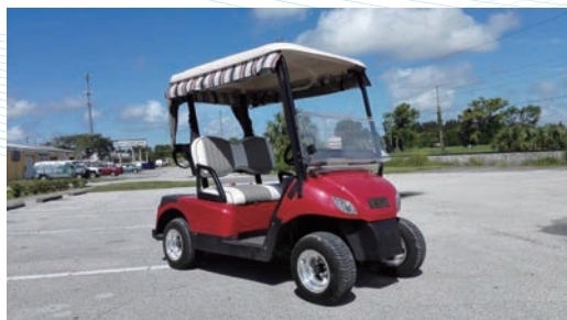
2018 俄羅斯世界盃場地車 100% 配套天能電池

隨著互聯網經濟與物流產業的發展，電動叉車市場增長迅猛。根據中國產業信息網統計，2017年全國叉車銷量超過37萬輛，其中電動叉車佔比由2011年的11%快速提升至2017年的40%，全國共有20億元電池需求。目前，天能叉車電池與安徽合力、杭叉集團、林德叉車、諾力叉車結成戰略合作夥伴關係，已成為全國國產第二大品牌。