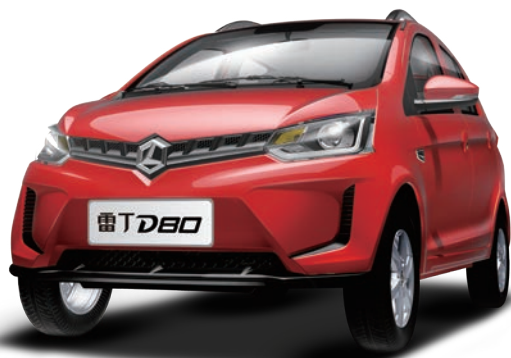
雷丁微型電動汽車主要採購天能電池

隨著交通環境多樣化及人民消費水平適度升級等因素驅動，微型電動汽車逐漸成為農村地區日常出行及城市地區「1+1」（即一輛燃油車加一輛微型電動汽車）出行的重要組成部分。根據中國化學與物理行業研究協會統計，目前全國微型電動汽車市場保有量為600萬輛，年新增量為100萬輛。集團在報告期內參展在山東舉行的「第十二屆國際新能源汽車電動車展覽會」、在天津舉行的「第十八屆中國北方國際自行車電動車展覽會」，推出長壽命、強動力、耐低溫、高能量、精工藝的新型電池；成功舉辦「微型車百公里拉力賽」和「榜樣的力量 — 全國優秀共贏商大會」，彰顯品牌實力。天能在微型車電池領域持續保持市場領導地位。